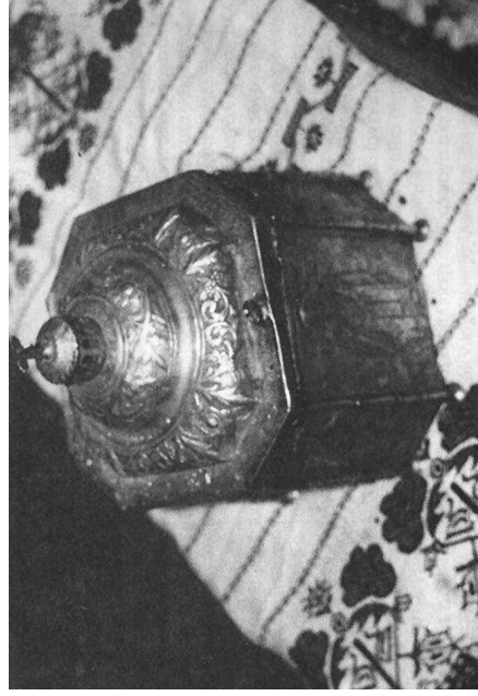
Ἰοστεφυλάκιο τοῦ Ἁγ. Γεωργίου ὅπου φυλάσσονται ὀστά τοῦ Ἁγ. Χαραλάμπους.