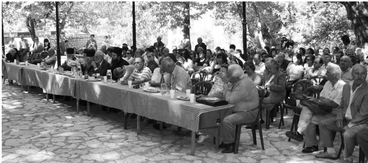
Άποψη απ' το ακροατήριο του Συνεδρίου στα Μεγάλα Βραγγιανά