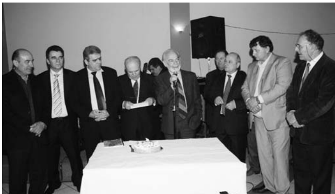
Ο Βουλευτής Ευρυτανίας κ. Καρανίκας απευθύνει θερμό χαιρετισμό.

Οι αξιόλογες Διοικήσεις των Πολιτιστικών Συλλόγων των Απανταχού Βραγγιανιωτών, μας έδειξαν ότι πρέπει να είμαστε αγαπημένοι, αλληλέγγυοι, μονιασμένοι και ενωμένοι με ανθρώπινη αξιοπρέπεια, για το καλό του τόπου μας.