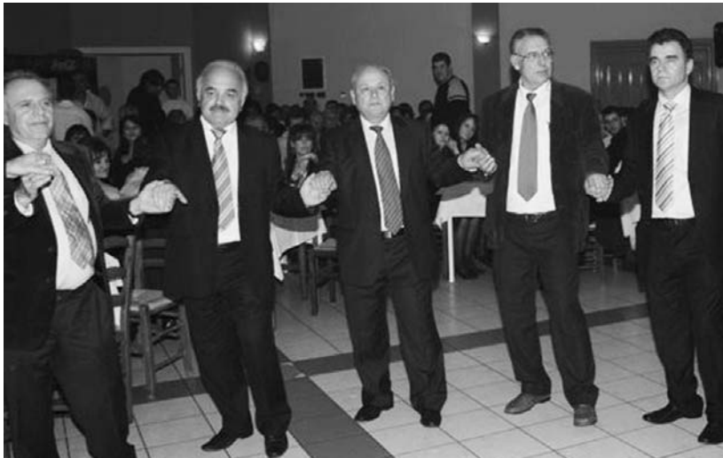
Από το χορό

Ανέφερε επίσης την πληροφορία, ότι επίκειται η εγκατάσταση πάρκου ανεμογεννητριών στο πανέμορφο και πεντακάθαρο φυσικό περιβάλλον των Αγράφων, στο μοναδικό φυσικό μνημείο και μέτρο καθαρότητας, στην καρδιά της ελληνικής γης, λέγοντας ότι, οι Αγραφιώτες δεν θα επιτρέψουν την καταστροφή του.