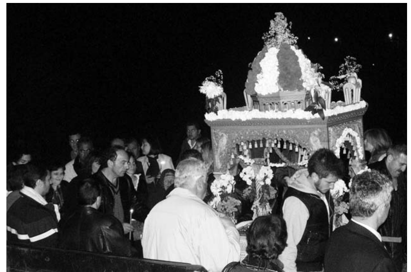
Από την περιφορά του Επιταφίου

Πιστεύω πως όσο απομακρυνόμαστε από την Φύση χάνουμε και το νόημα της ζωής. Πάντα η ζωή στο χωριό ήταν διαφορετική από την ζωή της πόλης. Όλοι μας αναπολώντας στο παρελθόν λέμε, τι ωραία ήταν η ζωή στο χωριό, τι χάρη είχε η ζεστασιά των ανθρώπων, τι νόστιμα ήταν τα φαγητά ή τα προϊόντα που παραγόταν κ.τ.λ. Στις μέρες μας βλέπουμε να παίρνουν μέ-