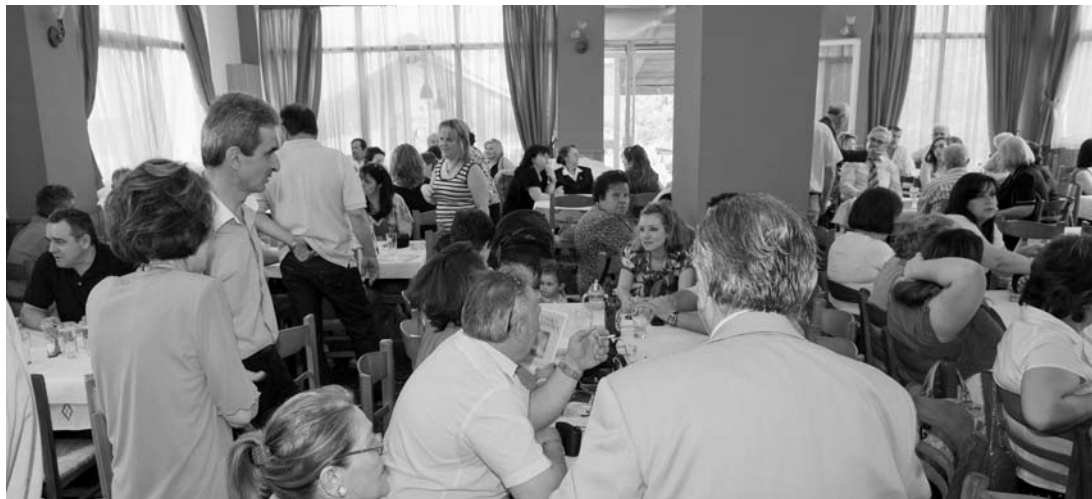
Άποψη της εορταστικής συγκέντρωσης για τα 30 χρόνια λειτουργίας του Συλλόγου

Το πρώτο μέρος ήταν μια αναδρομή μνήμης με υλικά- και σταθερή παρακαταθήκη για το μέλλον- τα τριάντα (30) μέλη της ιδρυτικής πράξεως (10 Ιουνίου 1979), του Πολιτιστικού Συλλόγου Βραγγιανιωτών με την επωνυμία «Αναστάσιος Γόρδιος». Τα ιδρυτικά μέλη με τους δικούς τους ανθρώπους, συγγενείς των κεκοιμημένων ιδρυτικών μελών, μέλη και φίλοι του Συλλόγου ένωσαν το χθές με το σήμερα· εικόνες αποσπασμένες από το παρελθόν έγιναν ένα παρόν διαρκείας και όλοι έζησαν μίαν αληθινά ζεστή, αγαπητική, αναγεννητική, αναζωογονητική των αισθήσεων κατάσταση, με συγκίνηση αλλά και χαρά,