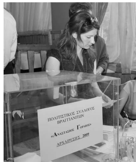
Από τη διαλογή των ψήφων