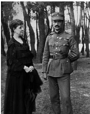
Η Πηνελόπη Δέλτα με τον Νικόλαο Πλαστήρα το 1923

Τον καιρό εκείνο, οι Εβραίοι είχαν χάσει πια