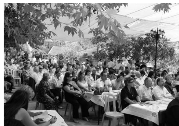
Άποψη από το κοινό της Ημερίδας στη Βούλπη

δήλωση αυτή να σηματοδοτήσει την αρχή για σειρά παρόμοιων εκδηλώσεων και σε άλλα χωριά του Νομού μας.