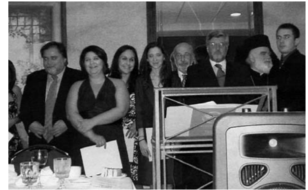
Από την απονομή των υποτροφιών και την ορκωμοσία του νέου Δ.Σ. της Ένωσης Ευρυτάνων «Το Βελούχι»

Στις 22-24 Ιουνίου, 2007 στο Γκρίνσμπορο της Β. Καρολίνας, πραγματοποιήθηκε, με εξαιρετική επιτυχία, το 63ο Συνέδριο της Ένωσης Ευρυτάνων Αμερικής «ΤΟ ΒΕΛΟΥΧΙ».