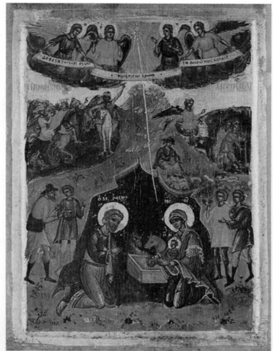
Διονυσίου τοῦ ἐκ Φουρνῶν, Γέννησις, 1711. Παρεκκλήσιον Τιμίου Προδρομίου, Καρφές.